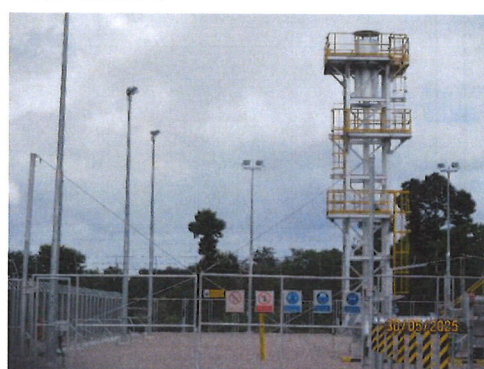
สถานีที่ 2 สถานีกลางทาง (Intermediate Block Valve Station)