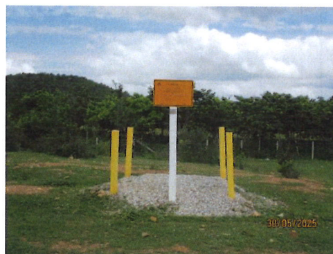
แนวท่อส่งก๊าซธรรมชาติ