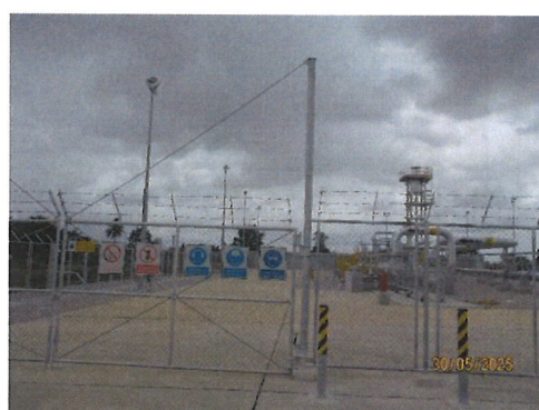
สถานีที่ 1 สถานีต้นทาง (Block Valve Station)